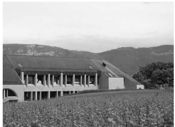
Projet de capteurs solaires voltaïques sur le toit de l'école Jolien

pour 2014 est d'atteindre le label « gold », c'est-à-dire, au moins 75% de réalisations par rapport aux exigences demandées.