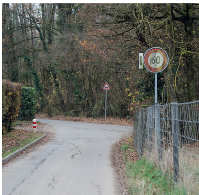
Croisement des chemins de Narly et des Marais

La qualité de vie des Configonnais et la sécurité sont en jeu. On se doit d'agir maintenant, n'attendons pas que l'accident grave se produise. Un seul exemple : laisser la limitation de vitesse à 60 km/h sur les chemins de Narly et des Marais est absurde et inconcevable, en l'acceptant, nos autorités prennent des risques inconsidérés.