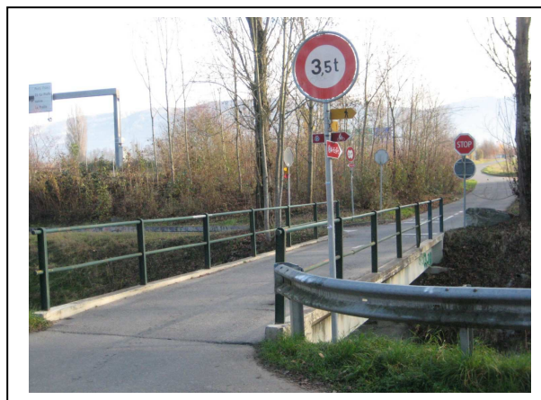
Le pont de la Praleta

Le 31 août 2011, le Grand Conseil a remis une motion (M 2022) au Conseil d'Etat demandant qu'une étude pour la construction d'une route (d'un gabarit de 13/14 mètres, selon l'exposé des motifs des motionnaires), reliant la route de Base à la route de Soral par le pont de la Praleta soit envisagée. Le Grand Conseil a donc voté cette motion afin que l'on profite de la 3 ème étape des travaux de renaturation de l'Aire pour entreprendre ces travaux, le pont de Mourlaz ne pouvant plus être emprunté puisqu'il sera fermé à la circulation.