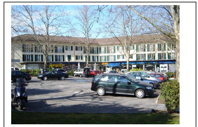
La place du village

Conformément à la loi, elle est traitée au conseil municipal suivant, celui du 20 septembre 2011. Lors des débats (en l'absence de tout public !?), le conseil penchait entre deux solutions, le renvoi au conseil administratif pour réponse négative ou le classement. En effet, le conseil a reconnu que le projet voté par la législature précédente était on ne peut plus démocratique avec séances de présentations publiques, consultations des différents groupes et que la délibération du conseil de la précédente législature était conforme à la loi. Par 9 oui et 7 non, le conseil a décidé de classer la pétition car cette dernière était adressée au conseil municipal et non au conseil administratif.